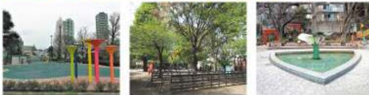
六本木西公園 筈公園 狸穴公園