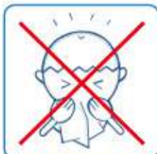
風邪の症状 おうちでゆっくりしよう